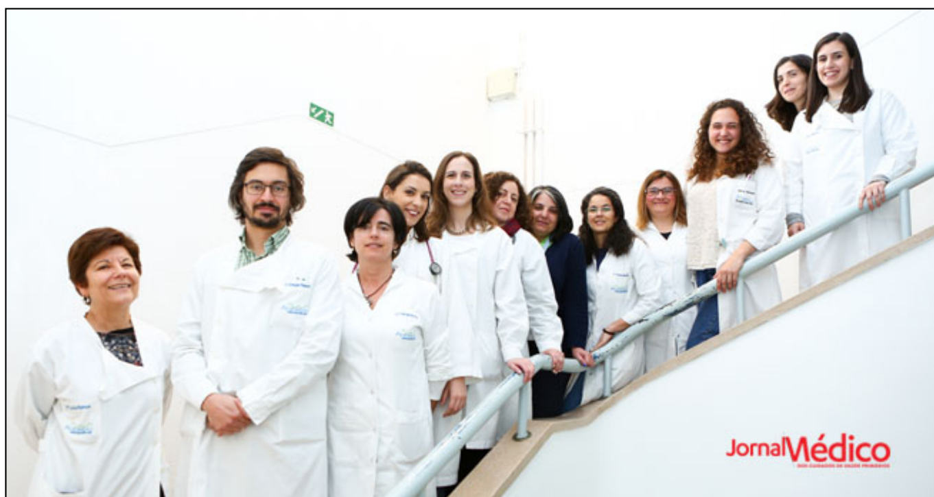
Elementos da Comissão Organizadora

O evento conta com a participação de preletores de USF, mas também de várias outras entidades. É o caso do Centro Hospitalar Lisboa Central, Instituto Superior de Psicologia Aplicada, Centro Hospitalar Psiquiátrico de Lisboa, IPO Lisboa, Grupo de Estudos da Sexualidade da Associação Portuguesa de Medicina Geral e Familiar e Associação ILGA Portugal - Intervenção Lésbica, Gay, Bissexual e Transgénero.