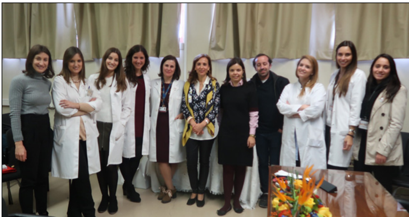
Equipa da UnIP na comemoração do 20.º aniversário

Desenvolvido por psicólogos clínicos e investigadores, o Be a Mom, um projeto-piloto de e-health no âmbito da prevenção da depressão pós-parto, vai ser brevemente disponibilizado a todas as mulheres cujo parto decorra na Maternidade Daniel de Matos. A iniciativa é da Unidade de Intervenção Psicológica (UnIP), que celebrou esta segunda-feira o 20.º aniversário.