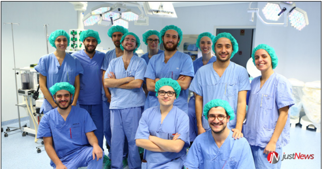
Alguns dos formandos e formadores da ação de formação