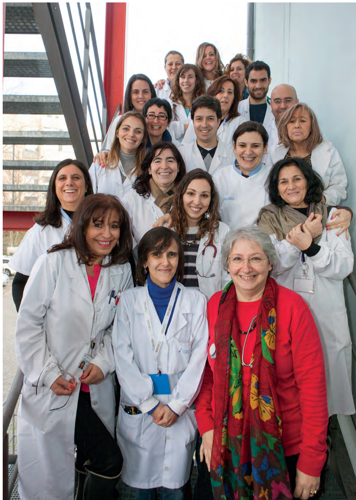
Equipa | Os doentes estão mais e melhor acompanhados

A enfermeira conclui, citando Immanuel Kant: "Toda a reforma interior e toda a mudança para melhor dependem exclusivamente da aplicação do nosso próprio esforço."